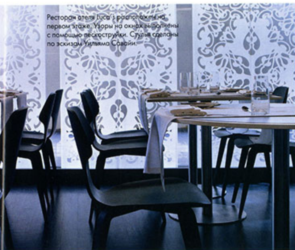
Ресторан отеля Luca's расположен на первом этаже. Узоры на окнах выполнены с помощью пескоструйки. Стулья сделаны по эскизам Уильяма Савая.