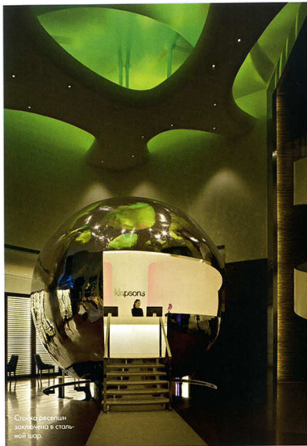
Стойка ресепшн заключена в стальной шар.

Дизайнер Уильям Савая — не любитель красивых фраз. Но работа над отелем Klapsons в Сингапуре даже его вдохновила на афоризмы. «Дизайн — это преодоление трудностей за счет изобретательности», — заявил он. Миниатюрный, всего на 17 номеров, отель пришлось пристраивать к офисному зданию. Владельцы небоскреба решили устроить гостиницу для своих деловых партнеров... и, разумеется, не ударить перед ними в грязь лицом. Задача была ясна и на первый взгляд невыполнима: произвести впечатление на людей, которых уже ничем не удивишь. Работа как раз для Уильяма Савая. Вместе с партнером Паоло Морони он владеет одной из самых авангардных мебельных марок мира — Sawaya & Moroni. Партнеры не моргнув глазом решаются на эксперименты, на которые не рискнула бы пойти ни одна другая компания. Например, именно они согласились запустить в производство диковинные объекты непризнанной в ту пору Захи Хадид. Один из них, диван Mogaine, украшает холл отеля. Но главный сюрприз — стойка ресепшн: она спрятана внутри пятиметрового стального шара. Блестящий как зеркало и окруженный миниатюрным рвом с водой, он напоминает спускаемый аппарат космического корабля. Сходство довершает ведущая внутрь