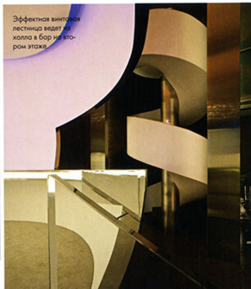
Эффектная винтовая лестница ведет из холла в бар на втором этаже.