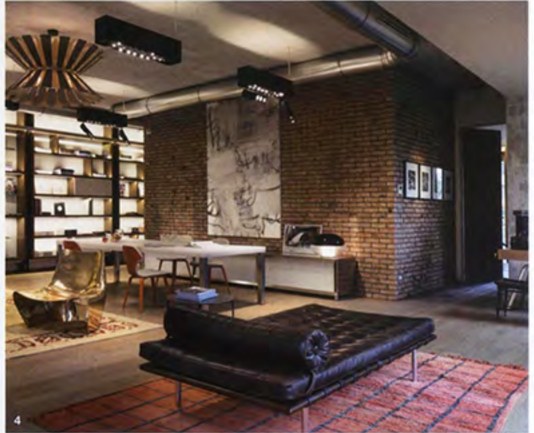
1 y 2 Una librería hasta el techo preside el salón-comedor. 3 En el hall, collage de fotografías de Olafur Eliasson. 4 La madera del suelo y el mobiliario suaviza el ambiente industrial, con muros de ladrillo e instalaciones vistas.

William Sawaya, el arquitecto y diseñador fundador de Sawaya & Moroni, es el autor de esta espectacular reforma en Moscú. Emplazado en el corazón de la capital rusa, el apartamento combina el espíritu de los tradicionales lofts con un diseño sobrio y de estilo 'chic', cumpliendo así las expectativas de su propietaria, una joven moscovita que quería una vivienda minimalista con un marcado toque local. "Provocativo, recargado, sin armonía y carente de tradición e historia, el interiorismo local ruso ha sido hasta hace poco ignorado por los arquitectos", explica Sawaya, que señala cómo la salida de muchos jóvenes a estudiar en el extranjero ha supuesto un punto de inflexión en el diseño de interiores de este país, "impregnado desde entonces de un nuevo sabor".